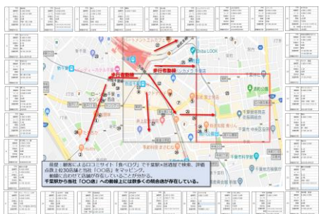
例▶店の商圈のこと、知っていますか？